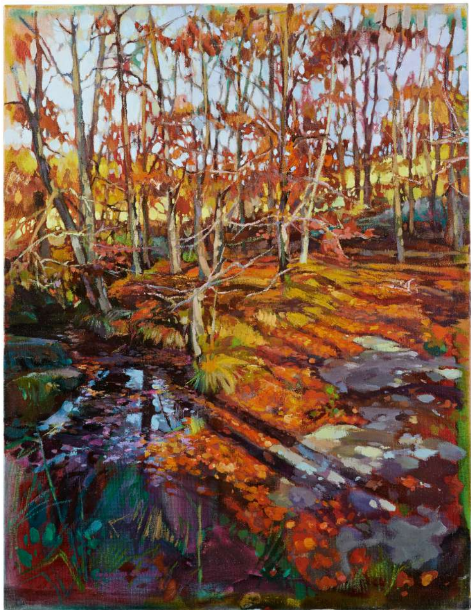
Fageda Rovellada 65 x 50 cm