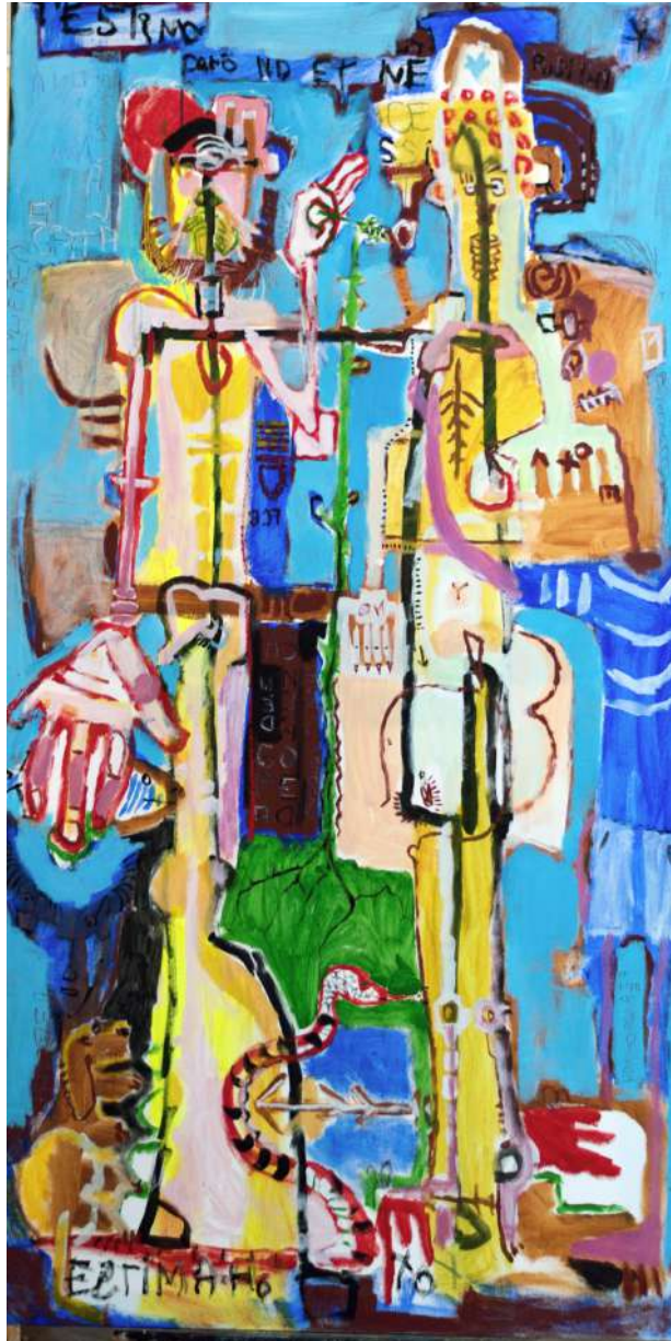
L'hereu i la Pubilla