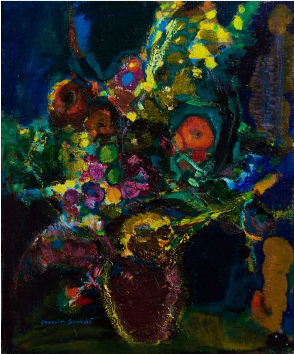
Flors Negres 46 x 38 cm